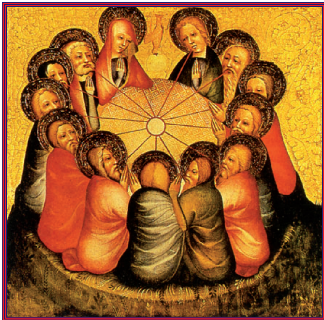
Il sole esterno anela a quello interno

Oggi nel pomeriggio vedrete alcuni Fratelli stranieri, ma ricordate sempre che gli "affari di Famiglia" della Nostra Gloriosa Obbedienza rimarranno sempre Nostri e non di altri.